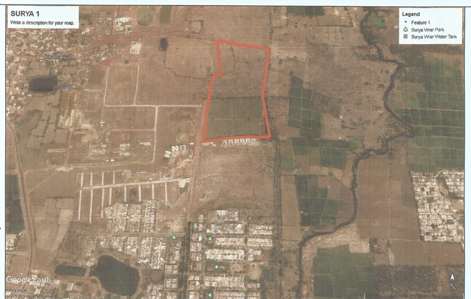
GOOGLE LOCATION PLAN LAYOUT(NTS)